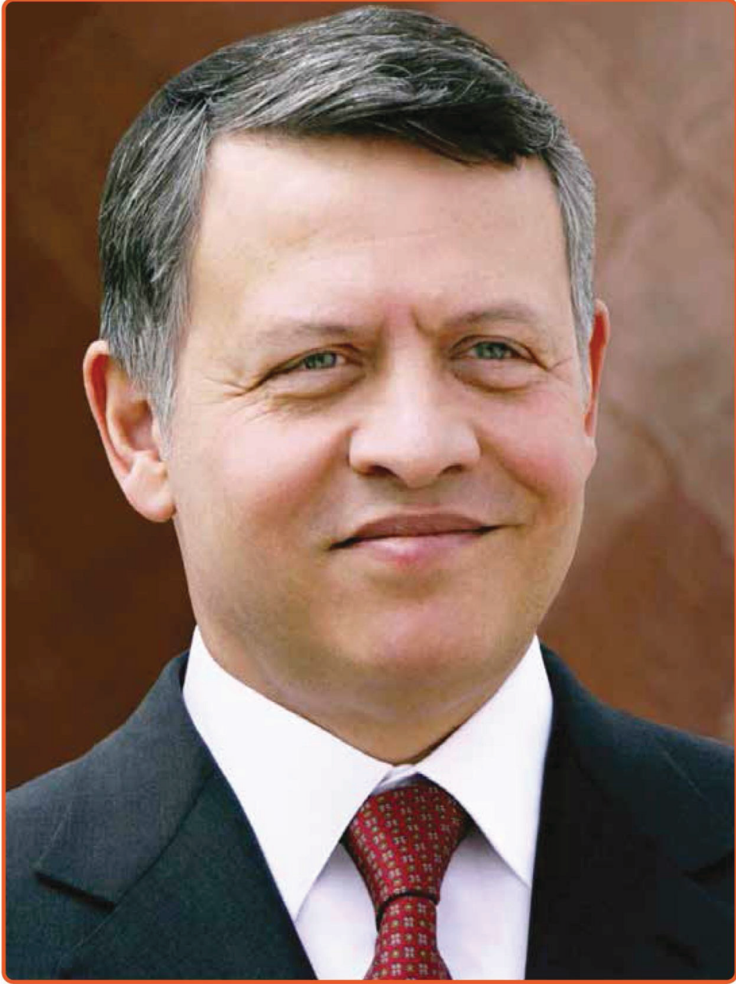
صاحب الجلالة الملك عبد الله الثاني بن الحسين المعظم