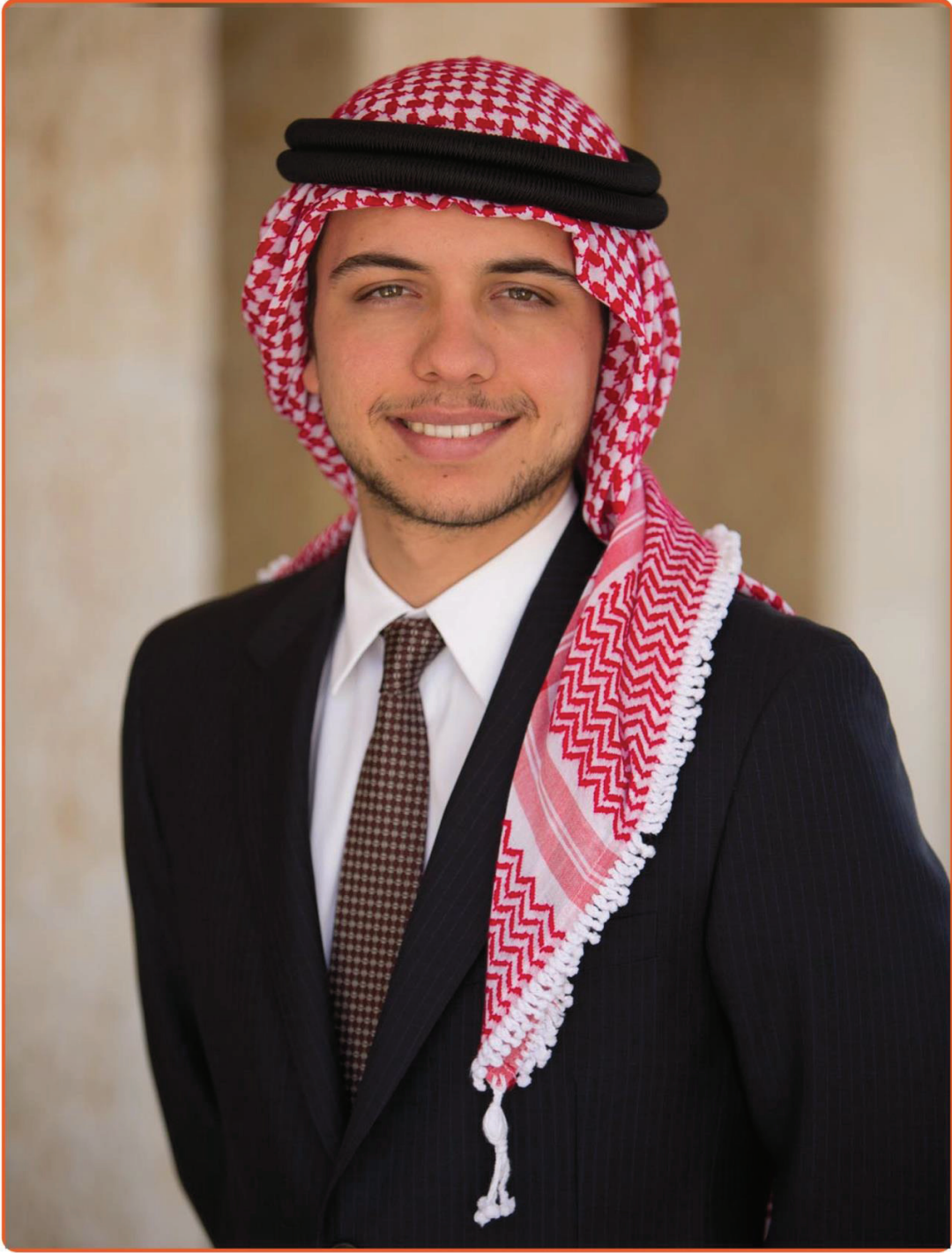
ولي العهد صاحب السمو الملكي الامير الحسين بن عبد الله الثاني بن الحسين المعظم